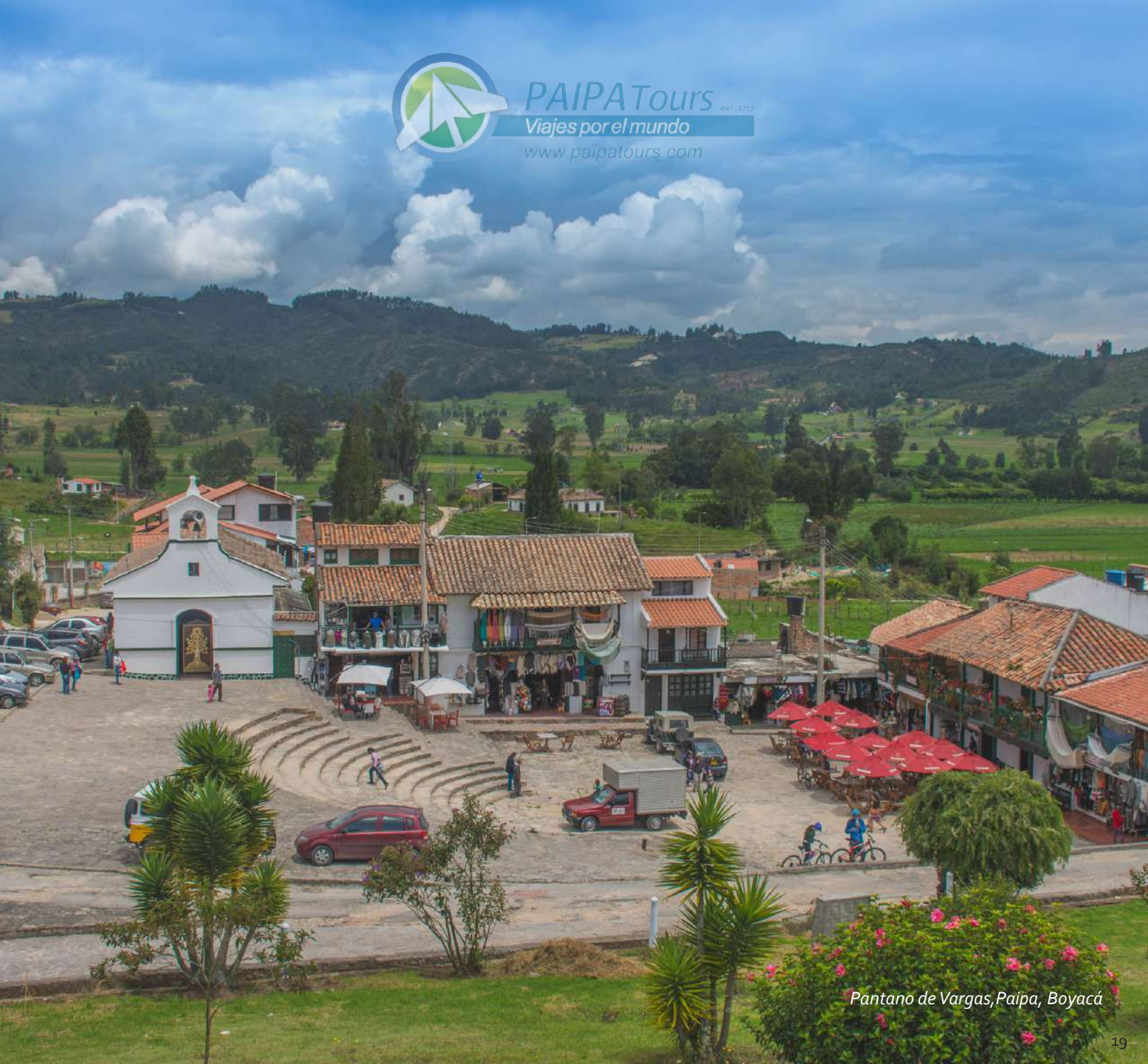
Pantano de Vargas, Paipa, Boyacá

PAIPA Tours RN1 3772 Viajes por el mundo www.paipatours.com