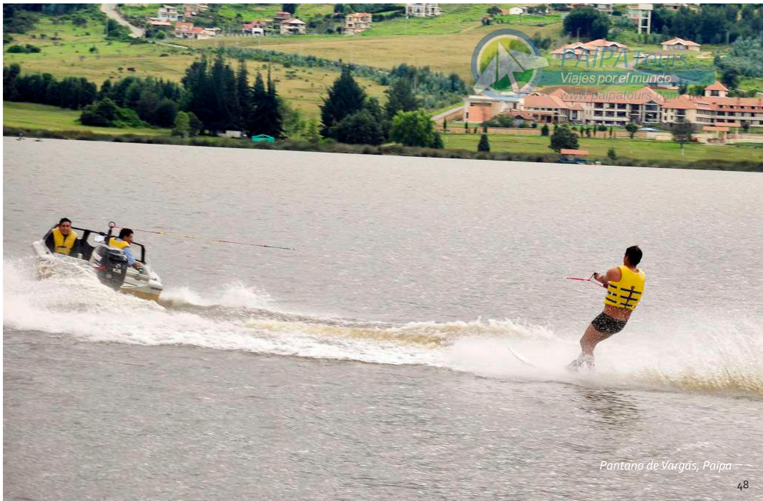
Pantano de Vargas, Paipa