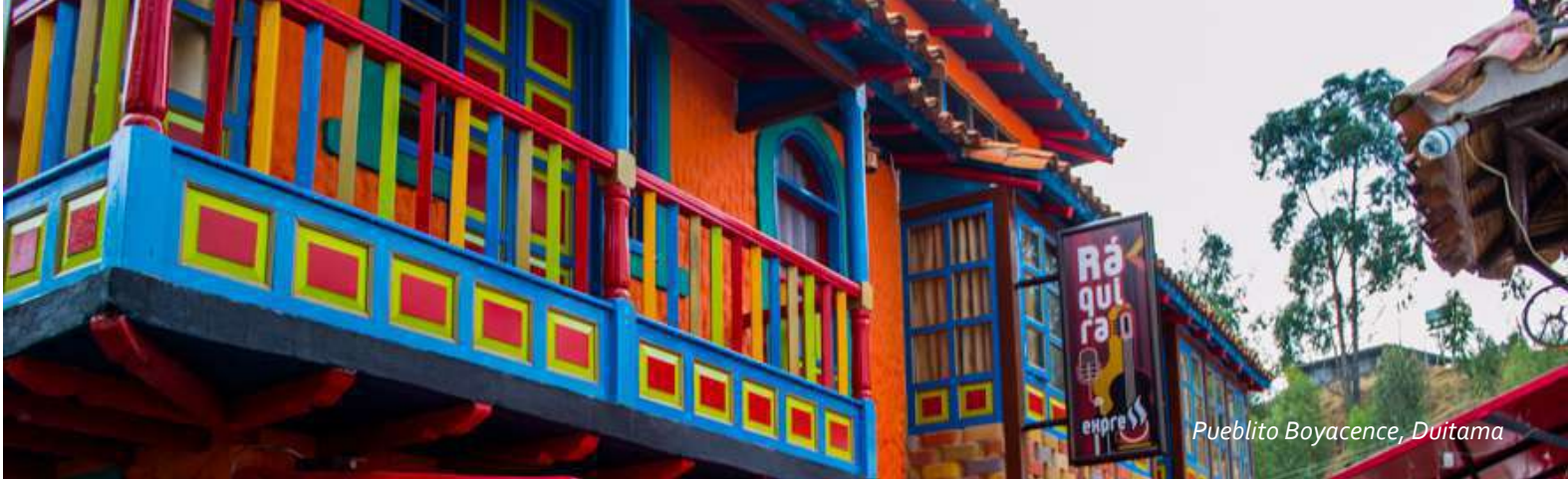
Pueblito Boyacence, Duitama