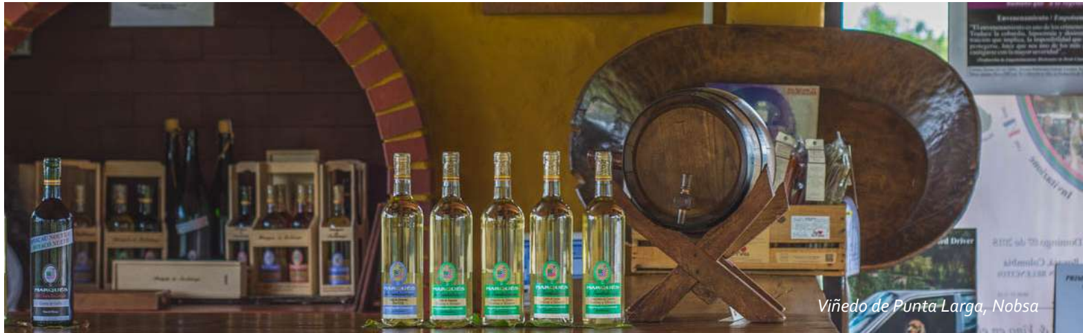
Viñedo de Punta Larga, Nobsa