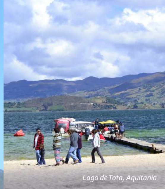
Lago de Tota, Aquitania