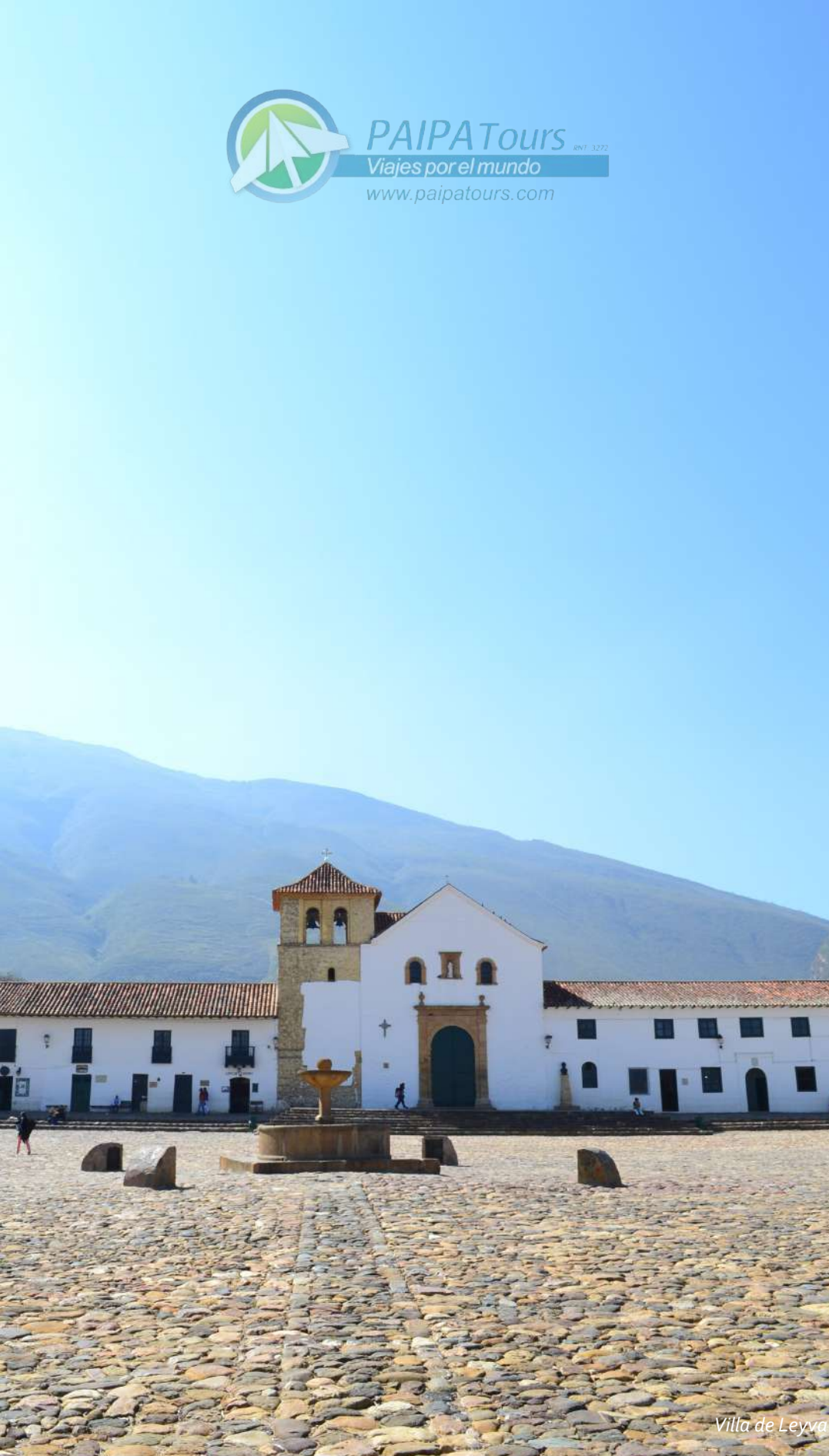
Villa de Leyva