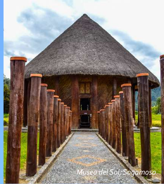
Museo del Sol, Sogamoso

PAIPATours RNT 3272 Viajes por el mundo www.paipatours.com