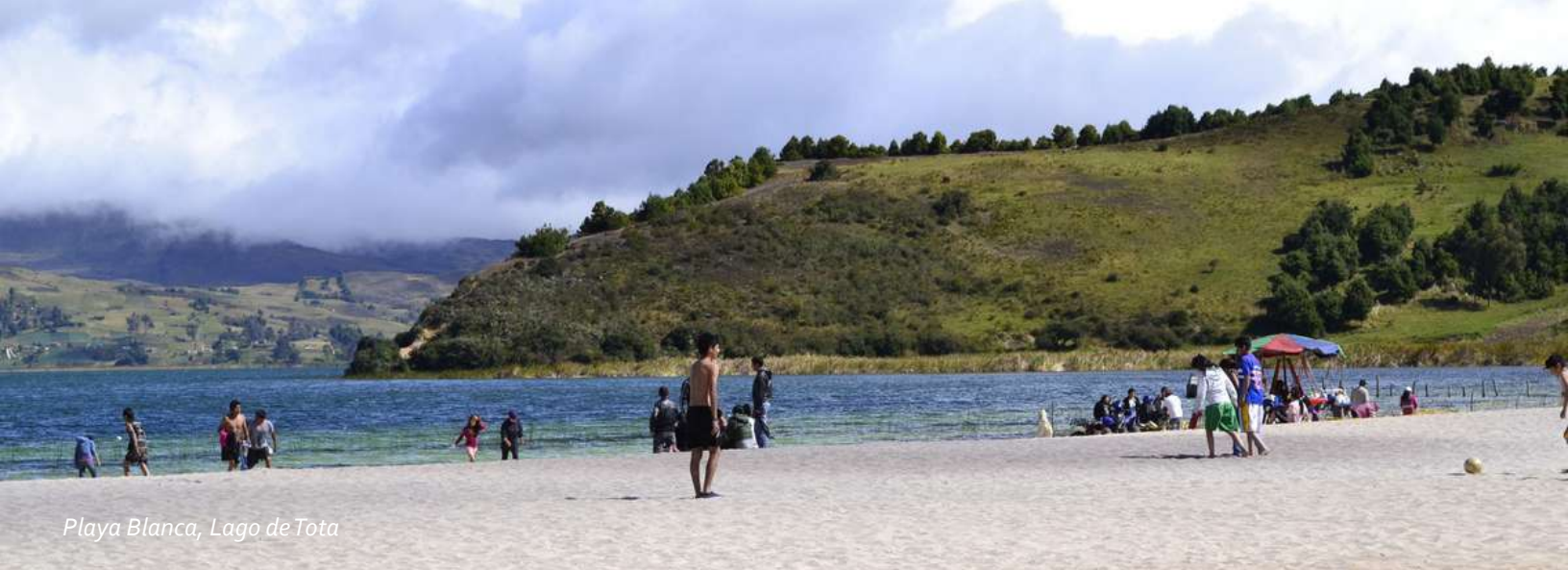
Playa Blanca, Lago de Tota