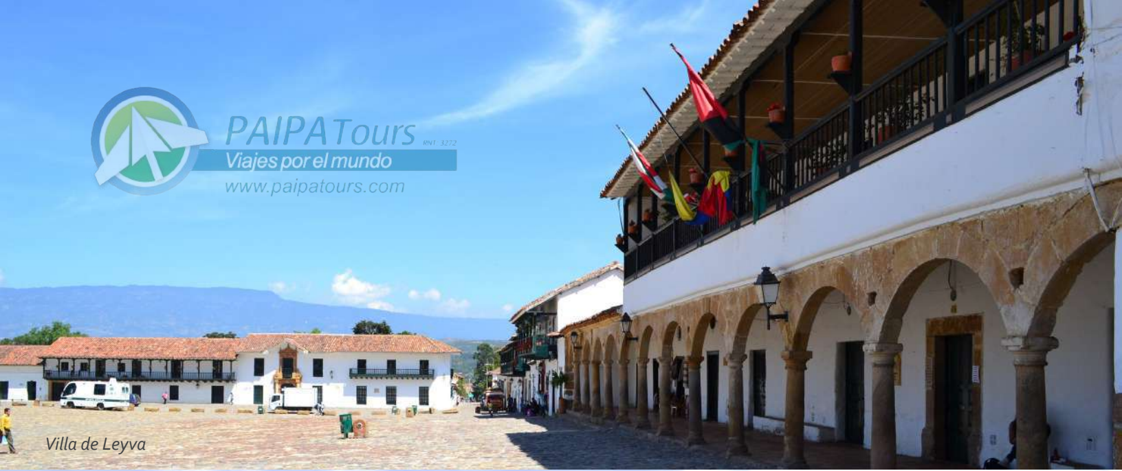
Villa de Leyva

PAIPATours RNT. 3272 Viajes por el mundo www.paipatours.com