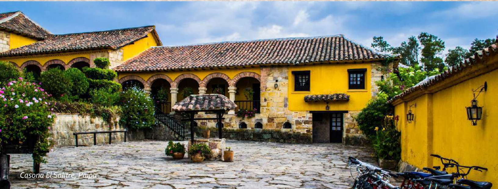
Casona El Salitre, Paipa