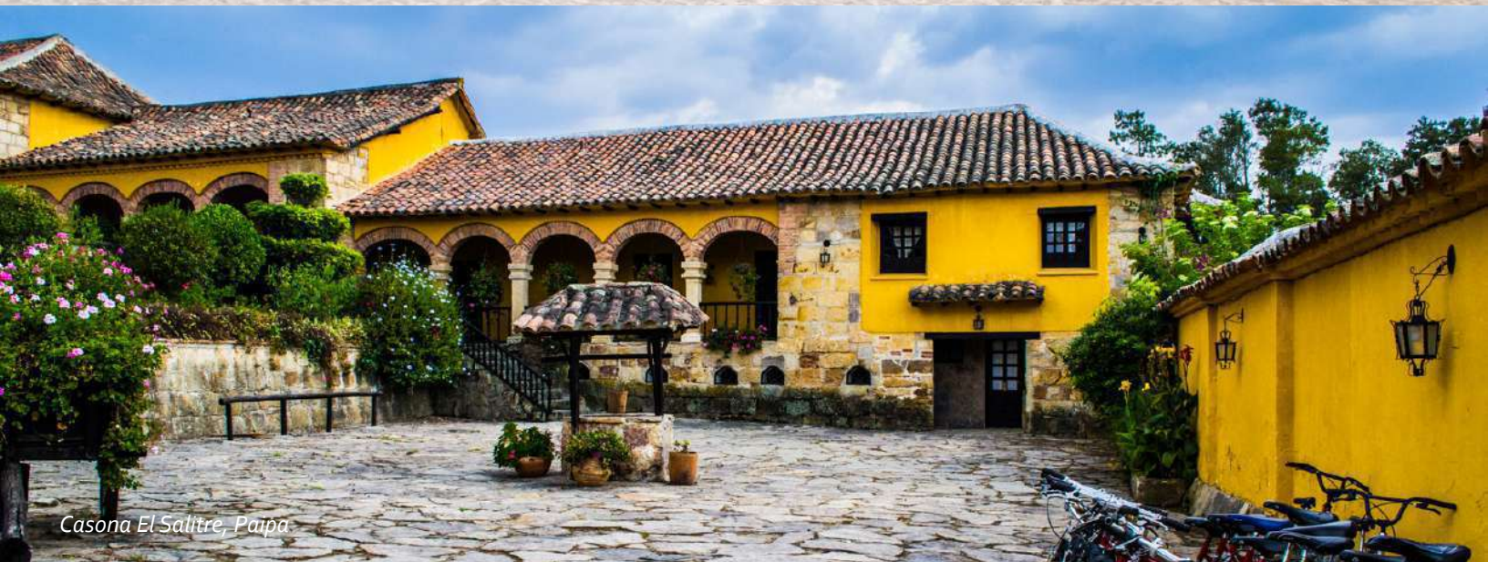
Casona El Salitre, Paipa