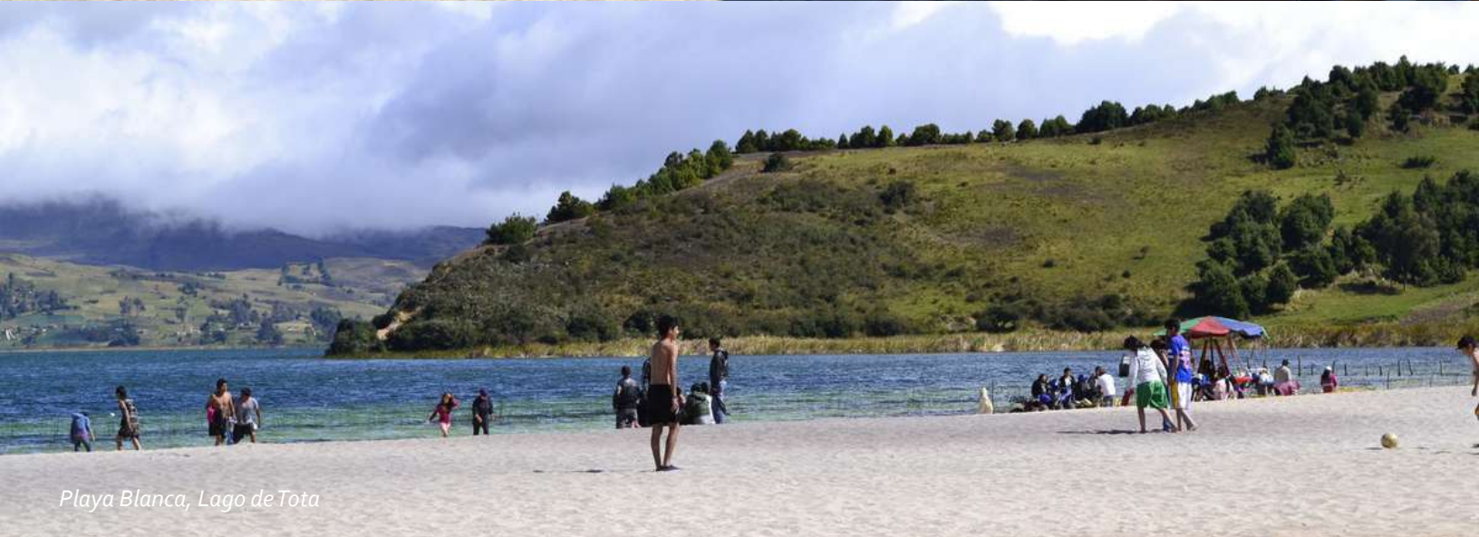
Playa Blanca, Lago de Tota