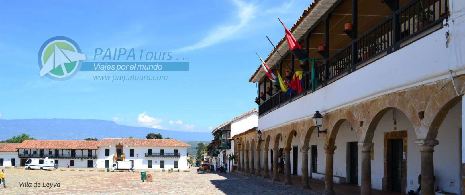
Villa de Leyva

PAIPATours RNT. 3272 Viajes por el mundo www.paipatours.com