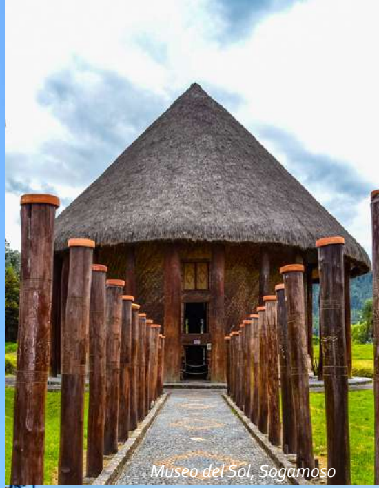
Museo del Sol, Sagamoso