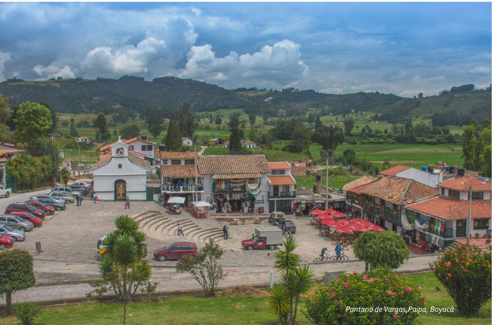
Pantano de Vargas, Paipa, Boyacá

*Pregunte por tarifas especiales para grupos.