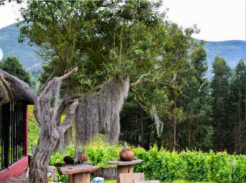
Viñedos de Punta Larga