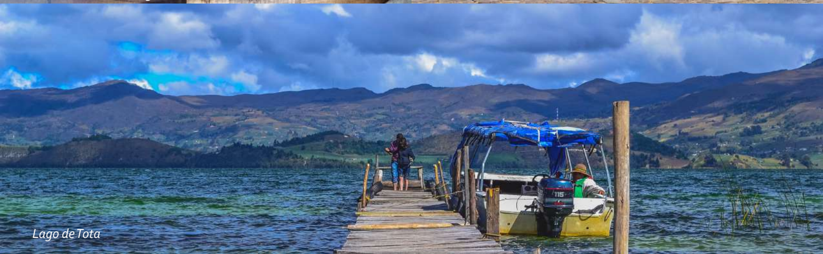
Lago de Tota