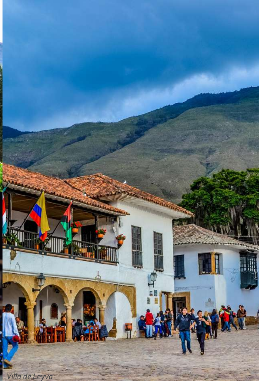
Villa de Leyva