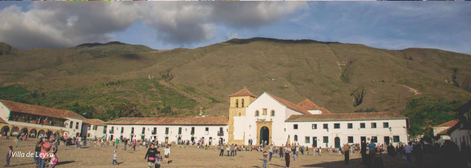
Villa de Leyva