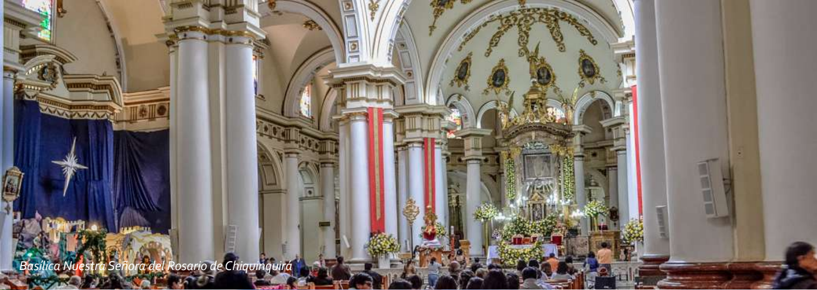
Basilica Nuestra Señora del Rosario de Chiquinquirá