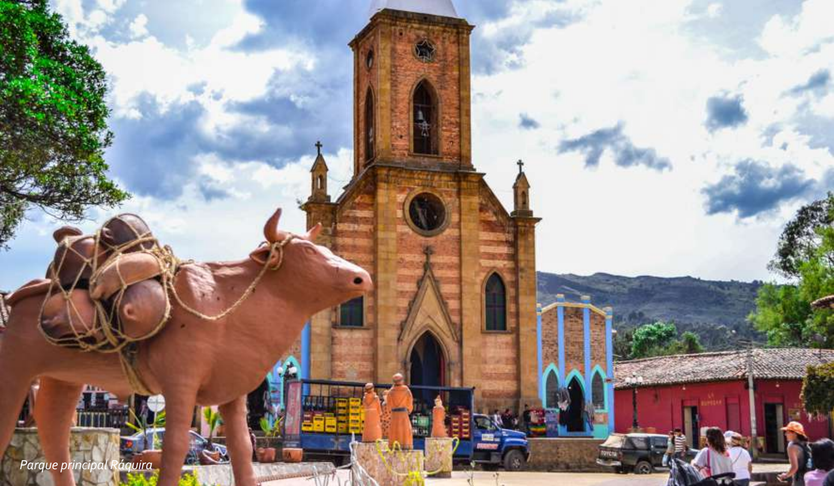
Parque principal Ráquira