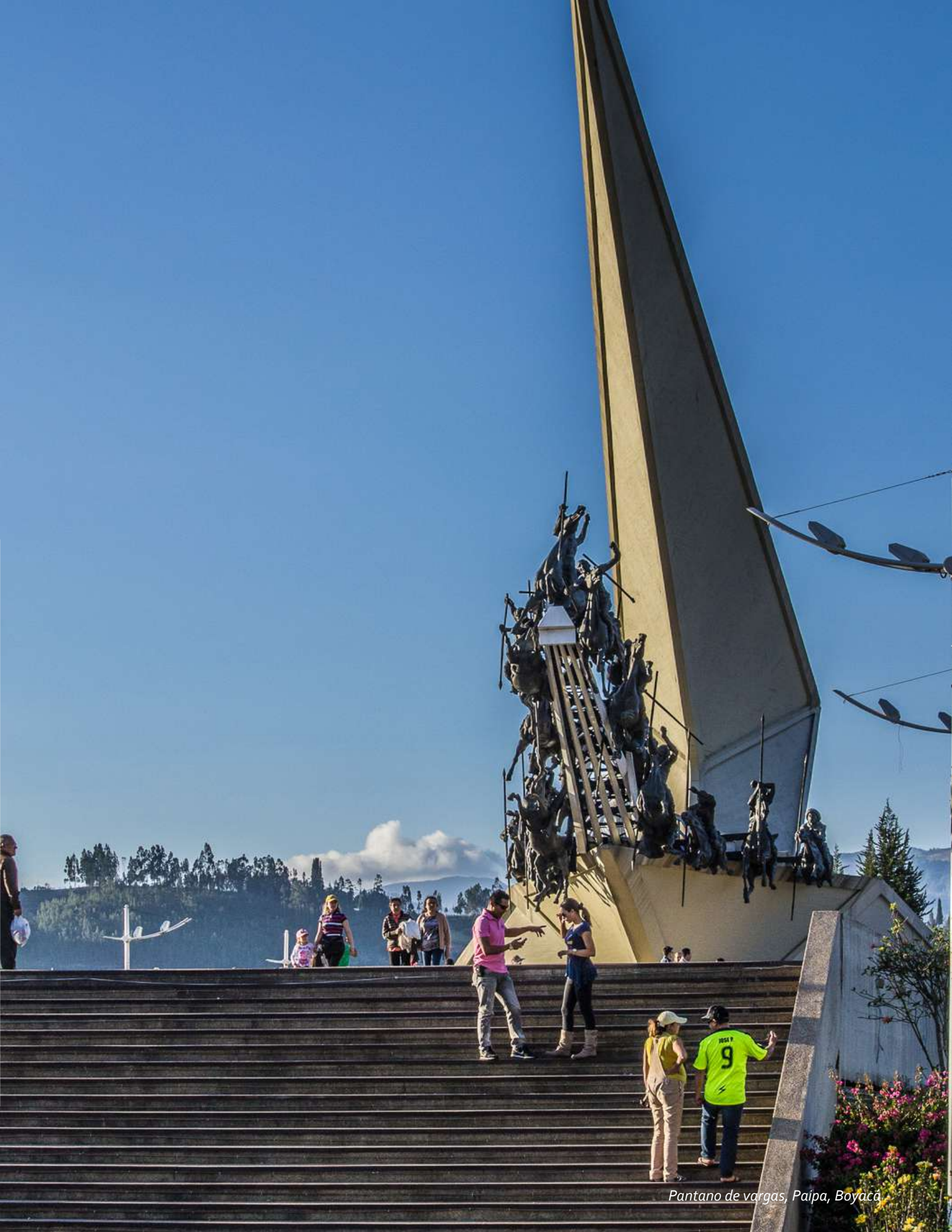
Pantano de vargás, Paipa, Boyacá